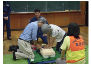
避難所訓練の一コマ