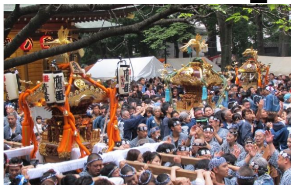
八幡社境内での三町会神輿の練りの様子