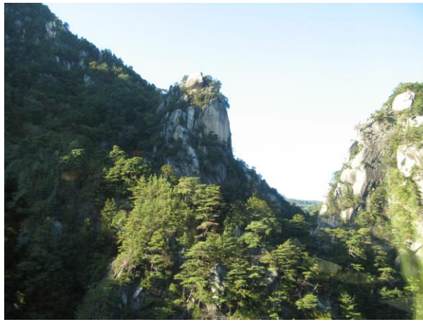
昇仙峡 覚円坊 昇仙峡のシンボル