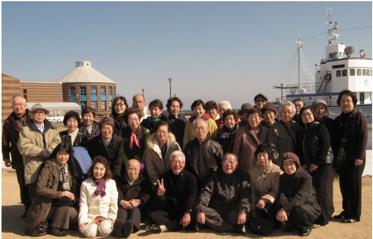
早春の陽だまりの中 参加者全員 はいポーズ！