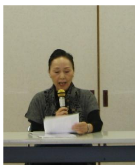
H23 年度決算報告 東崎会計