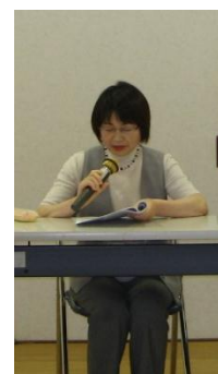
H24 年度予算 手島会計