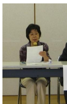
H23 年度事業報告 関 事業部長