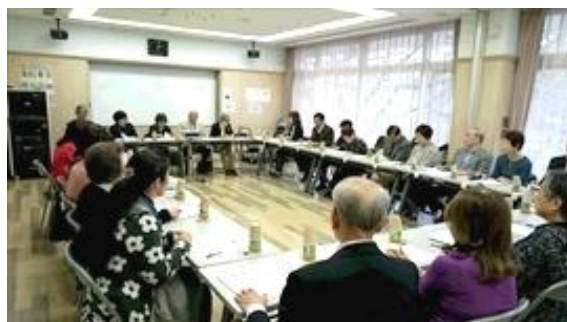
第一回利用者懇談会