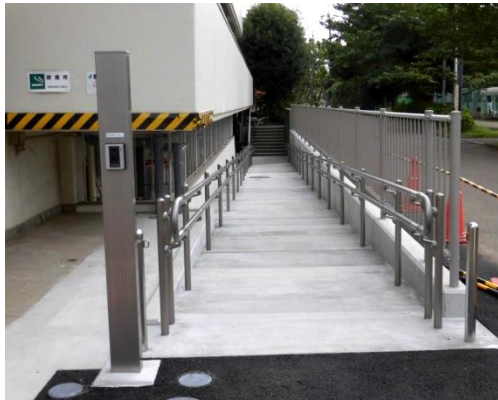
十五年間待っていました

体育館横にスロープが完成。車いすで体育館に入れます。バリアフリーが一步前進です。