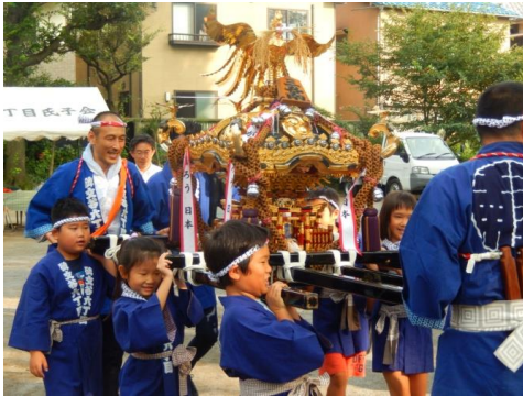
公園からお神輿の出陣

9月17、18日は八幡様のお祭り。公園を一時借りて、山車と子供神輿が町内を巡行しました。