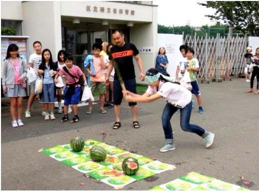
体育館前でのすいか割り

今年盆踊りは中止でしたが、近隣の碑文谷六丁目自治会のラジオ体操は体育館前で実施されました。