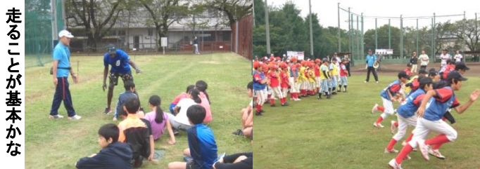
走ることが基本かな