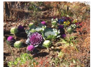
池周りの整然とした花壇