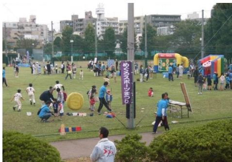
遊ぶことが基本かな