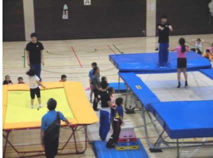
跳ぶことって素敵だね

プロの指導は子どもたちを虜にし、スポーツの種類之多さに、参加者の数に驚かされました。