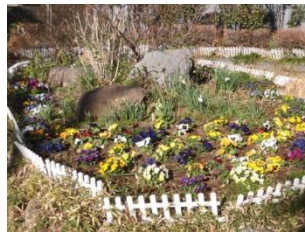
水仙も顔をのぞかせます