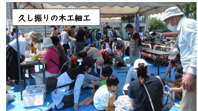
久し振りの木工細工