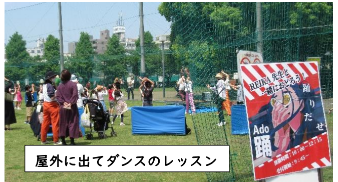
屋外に出てダンスのレッスン