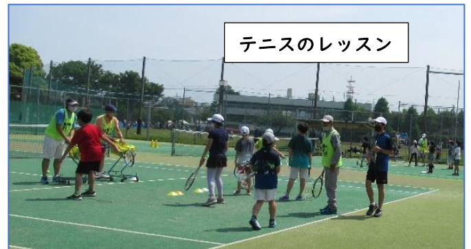
テニスのレッスン