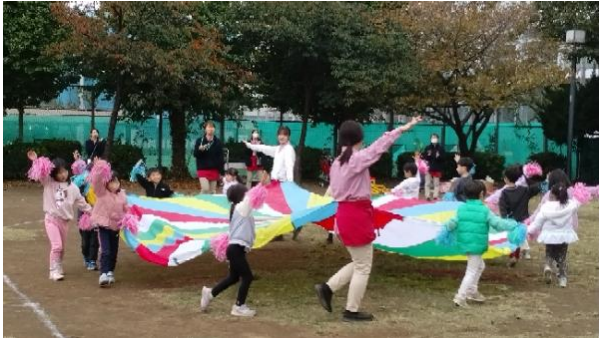
保育園でハロウィン