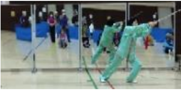
自由広場での運動会