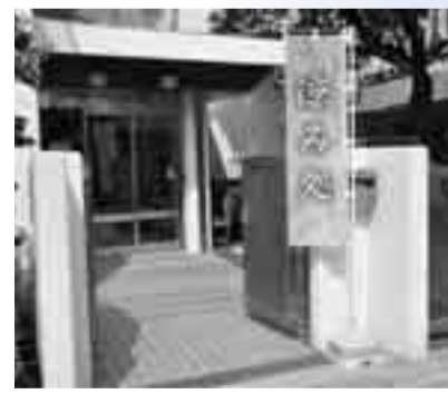
この「のぼり旗」が目印です

日中の暑いときを涼しく過ごすため 老人いこいの家や 高齢者センターに お立ち寄りください