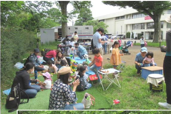
主役はポニーと親子連れ