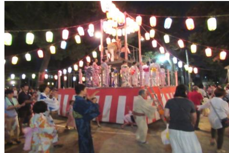
昨年の盆踊りの様子