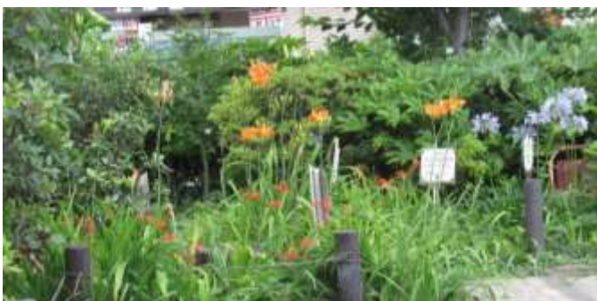
野草苑のノカンゾウ、ヒオウギスイセン素敵です