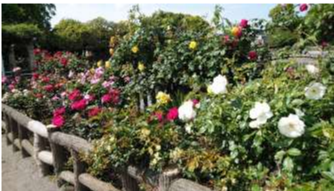
バラ園は色鮮やかな空間を提供してくれています