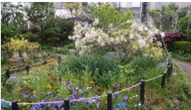
花の公園の白藤、見事でした