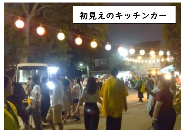
初見えのキッチンカー