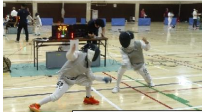
フェンシング大会